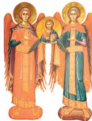
Sfinții Arhangheli Mihail și Gavriil

Pentru că întru El au fost făcute toate, cele din ceruri și cele de pe pământ, cele văzute și cele nevăzute, fie tronuri, fie domnii, fie începătorii, fie stăpânii. Toate s-au făcut prin El și pentru El.