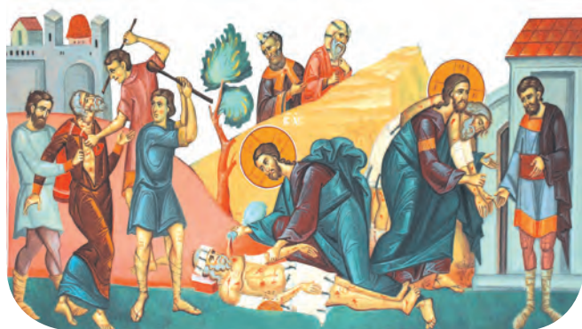
Pilda Samaritanului milostiv

2. Găsește corespondențele între coloane și transcrie în caiet enunțurile corecte.