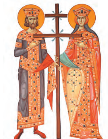
Sfinții Împărați Constantin și Elena

3. Sfinții au mărturisit credința atât prin cuvânt, cât și prin faptele lor bune. Privește icoana de mai sus: