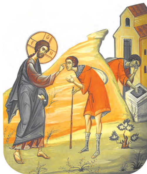
Vindecarea orbului din naștere

■ Cum a ajutat Mântuitorul Hristos oamenii care se aflau în dificultate?