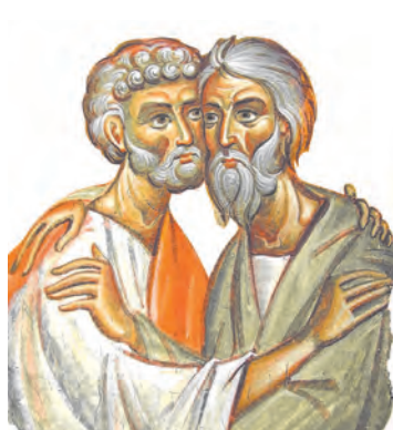
Sfinții Petru și Pavel