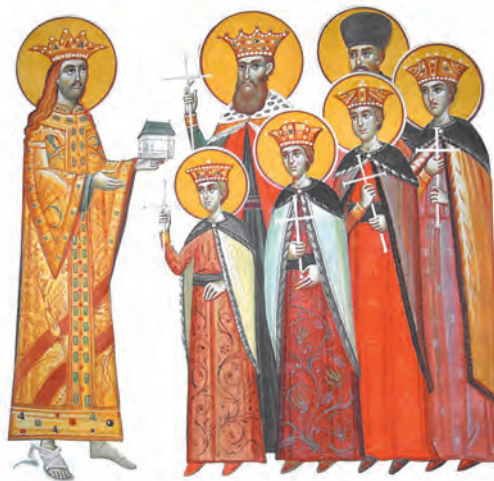
Sfântul Voievod Ștefan cel Mare și Sfinții Martiri Brâncoveni

4. Privește icoana Sfântului Andrei și cea de mai jos. Scrie un text de șase rânduri în care să arăți cum s-a răspândit și întărit creștinismul pe teritoriul țării noastre, folosind următoarele cuvinte: Dobrogea, apostol, călugări, ierarhi, credință, voievod, popor, sfinți, martiri.