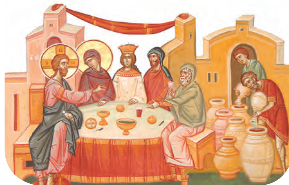
Nunta din Cana Galilei

4. Orice om dorește să devină mai bun. Alcătuieste o listă cu șapte reguli importante care te-ar ajuta în acest sens. Respectă-le!